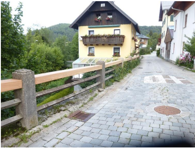
neues Geländer Messingstraße