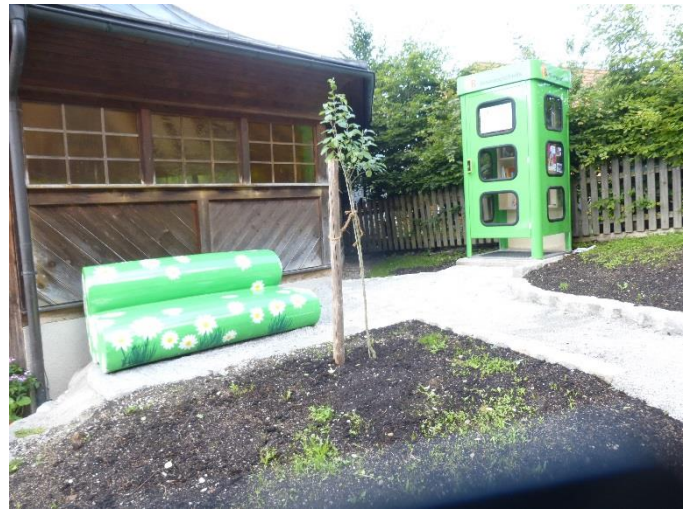
Plattform und Zugang zur Bücherzelle

Wir wünschen allen Lesern einen schönen Sommer 2018!